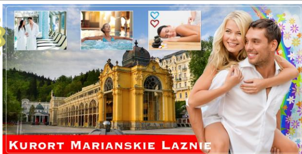
KURORT MARIÁNSKÉ LAZNĚ

Mariánské Lázně znane też jako Marienbad, należą do najpiękniejszych kurortów Czech. Zatopione wśród wzgórz, zachwycają secesyjną architekturą, pałacami, przyrodą i klimatem.